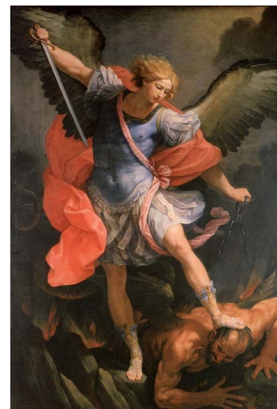
Guido Reni, S. Michele arcangelo, XVII sec.